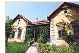
Muzeul Trofee de Vânătoare Str. Scoala de Înot, Nr. 4, Sibiu Tel. +40 269 217873