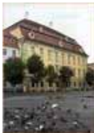
Palatul Brukenthal Piața Mare, Nr. 4 - 5, Sibiu Tel: (+40) 269 211699, 217691