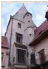
Muzeul de Istorie Str. Mitropoliei, Nr. 2, Sibiu Tel: (+40) 269 218143