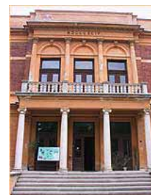
Muzeul de Istorie Naturală Str. Cetatii, Nr. 1, Sibiu Tel: (+40) 269 213156