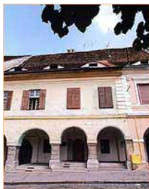
Muzeul de Istorie a Farmaciei Piața Mică, Nr. 26, Sibiu Tel. +40 269 218191